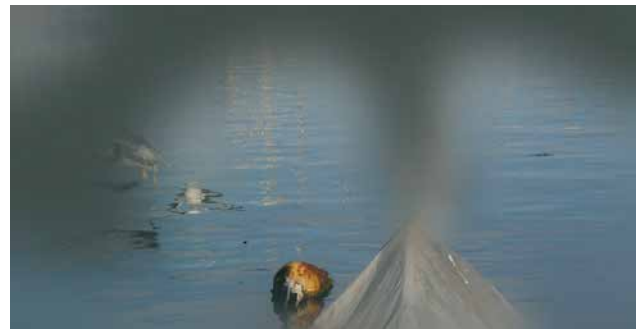
Abb. 2: Fortschreitender Gesichtsfeldausfall bei Glaukom

Bei verdächtigem Befund wird gegebenenfalls eine Gesichtsfelduntersuchung ergänzt. Auch die 3D-Vermessung des Sehnervenkopfes mittels der HRT-Untersuchung gibt dem Arzt einen diagnostischen Frühindikator für einen Fortschritt der Erkrankung.