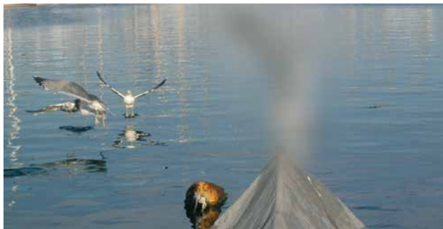
Abb. 1: Fortschreitender Gesichtsfeldausfall bei Glaukom

Diese Erkrankung führt unbehandelt zu einem fortschreitenden Verlust des Gesichtsfeldes und schließlich zur Erblindung (Abb. 1–3). Dieser schleichende Gesichtsfeldverlust geschieht für den Betroffenen nahezu unmerklich.